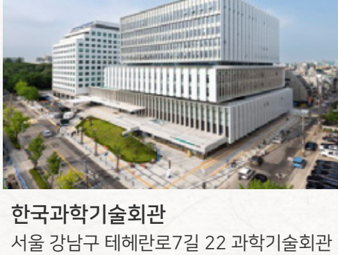
한국과학기술회관 서울 강남구 테헤란로7길 22 과학기술회관 (강남역 12번 출구)